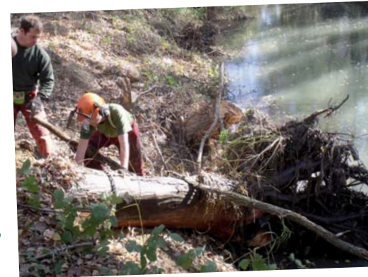
À l'amont des zones habitées ou des ouvrages, les embâcles sont systématiquement retirés – Lieu-dit les Fayardes, Cavaillon, 2015.

Le technicien de rivière du syndicat peut se rendre sur place pour apporter un conseil.