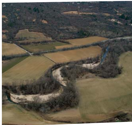
Méandres sur le Calavon-Coulon au niveau de Saint-Martin-de-Castillon illustrant la dynamique du cours d'eau.

La rivière transporte naturellement des cailloux, des graviers et du sable . C'est pourquoi son cours est constamment modifié, entraînant la création de méandres et générant de nouveaux paysages. Ce déplacement de matériaux varie dans le temps et dans l'espace mais est nécessaire à la bonne santé du cours d'eau et à l'équilibre des milieux aquatiques . L'érosion et les dépôts de sédiments consécutifs à ce transport permettent notamment de dissiper l'énergie de l'eau et de réduire les vitesses. Ces modifications du lit ne doivent pas être confondues avec les déséquilibres sédimentaires.