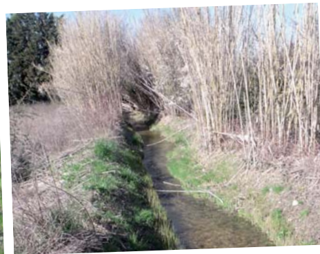
La coupe à blanc* de la ripisylve laisse souvent place aux espèces invasives telles que la canne de Provence (Le Boulon aux Taillades).