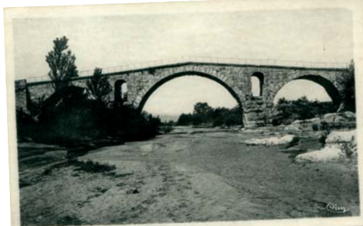
Le pont Julien au début des années 1900.

Les extractions de matériaux menées au cours du XX ème siècle, associées au reboisement des versants, ont durablement impacté le Calavon-Coulon. Ces extractions, outre leur impact sur la nappe et les milieux humides associés, ont entraîné un enfoncement généralisé du lit, appelé "incision", dont atteste la désstabilisation de certains ouvrages : ponts, digues, berges. C'est pourquoi, l'aménagement et l'entretien des cours d'eau doivent prendre en compte ce déséquilibre sédimentaire afin de ne pas l'aggraver.