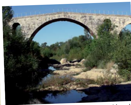
Le pont Julien de nos jours. L'apparition du socle rocheux témoigne de l'incision du lit.

Le curage systématique d'un un cours d'eau provoque plus de problèmes qu'il n'en résout . Il contribue notamment à l'enfoncement du lit sur des linéaires qui peuvent être très importants et entraîner l'aggravation des effets des crues, en particulier la désstabilisation des ouvrages et des berges.