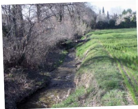
Le déboisement total de la végétation favorise l'érosion des berges. (Ici sur le Boulon aux Taillades).

On observe alors une érosion excessive du lit, l'aggravation des inondations, le développement d'espèces envahissantes, l'effondrement des berges et la désaffectation des ouvrages (ponts, routes...).