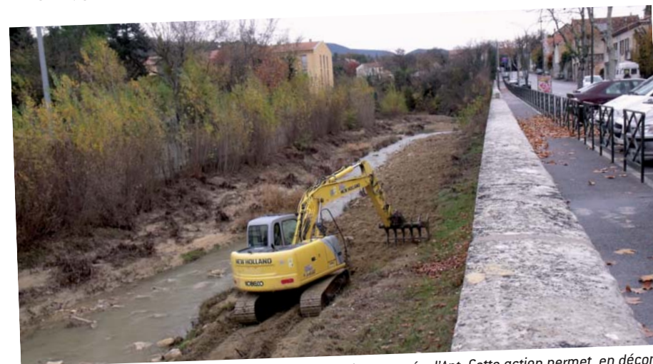
Scarification d'un banc de galets par le SIRCC dans la traversée d'Apt. Cette action permet, en décompactant les matériaux par griffage, et en détruisant les systèmes racinaires, de faciliter la remobilisation du banc lors des prochaines crues sans provoquer de déséquilibre sédimentaire.