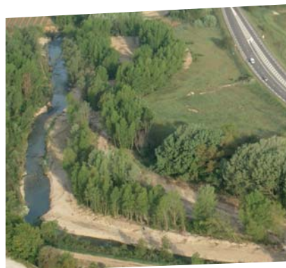
Les zones naturelles à proximité du lit sont favorables à la mobilité latérale du cours d'eau. (Le Calavon à Goult).

Pour limiter l'impact des crues sur les secteurs sensibles, il est important de conserver, voire restaurer les emplacements en milieu naturel où la rivière peut dissiper son énergie. Ainsi, les espaces de liberté et les zones d'expansion de crues assurent un rôle de prévention des inondations pour les parcelles situées plus en aval. Favoriser la divagation du cours d'eau, optimiser le rôle des zones d'expansion de crue, rechercher des secteurs propices à l'écrêtement : tels sont les projets ambitieux poursuivis par le Syndicat de Rivière sur son territoire.