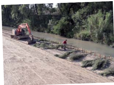
Des pieux plantés, entre lesquels sont tressées des branches de saule, forment une protection de pied de berge appelée "fascine". (Travaux d'aménagement du Coulon à Cavaillon, 2016).