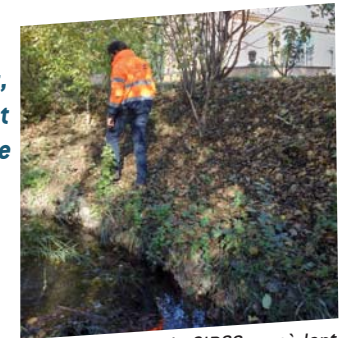
Les techniciens du SIRCC procèdent régulièrement à la surveillance de l'état des berges et des digues.

Pour faciliter les interventions du Syndicat, il est important que les riverains accordent un droit de passage aux agents en charge de l'entretien et de la surveillance des berges.